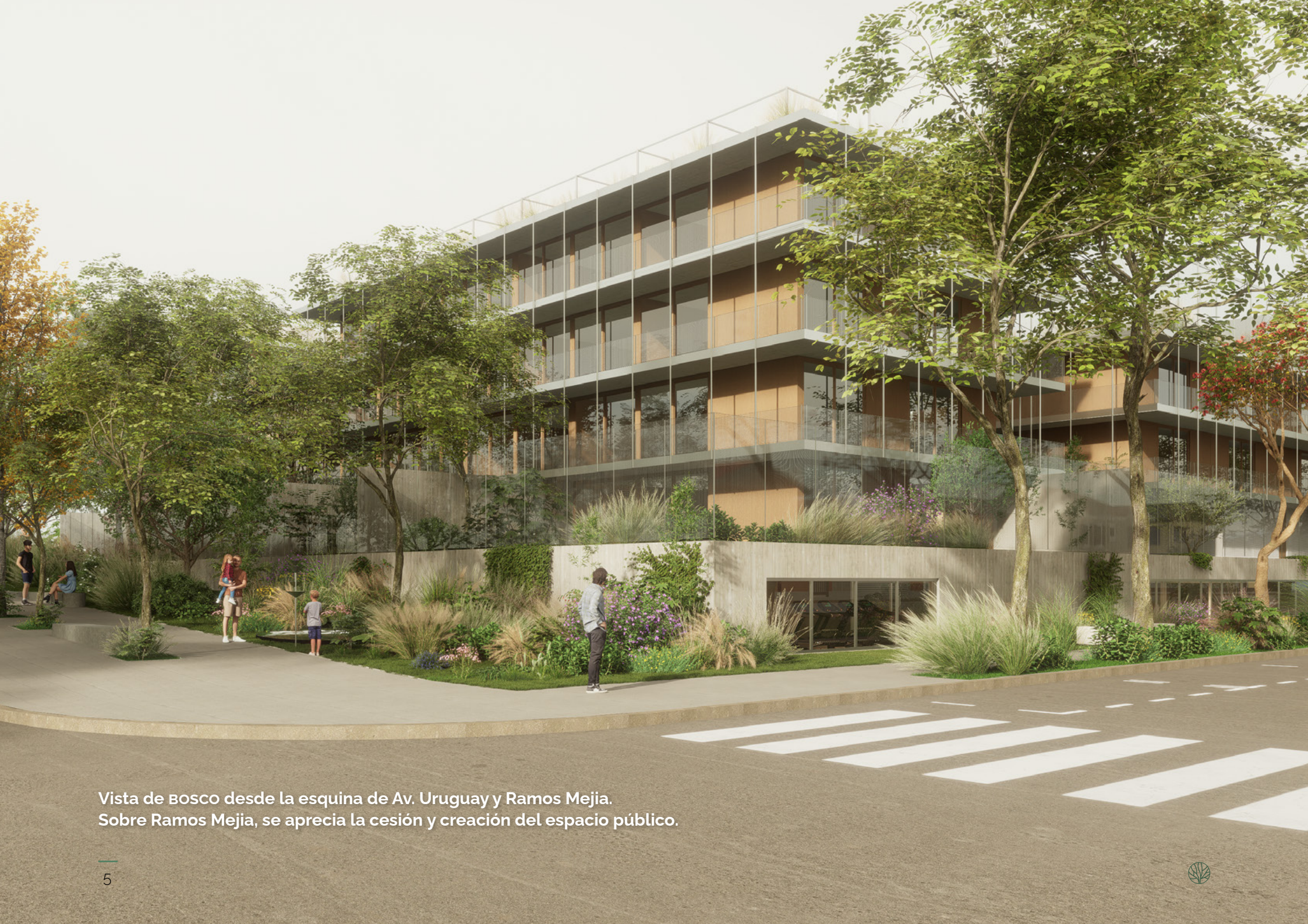
Vista de BOSCO desde la esquina de Av. Uruguay y Ramos Mejia. Sobre Ramos Mejia, se aprecia la cesión y creación del espacio público.