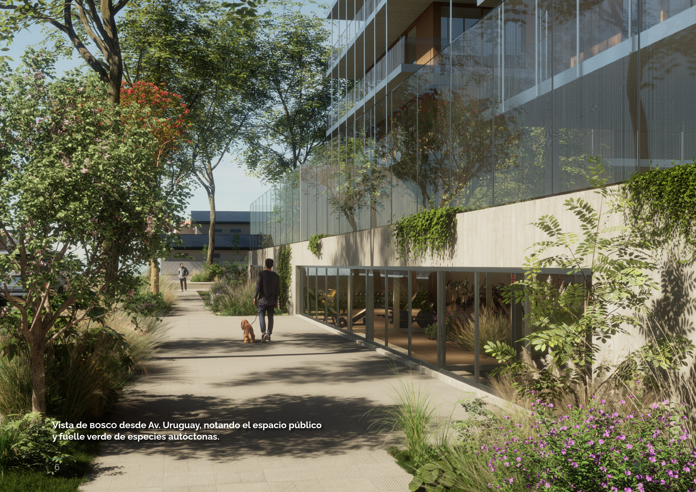
Vista de BOSCO desde Av. Uruguay, notando el espacio público y fuelle verde de especies autóctonas.