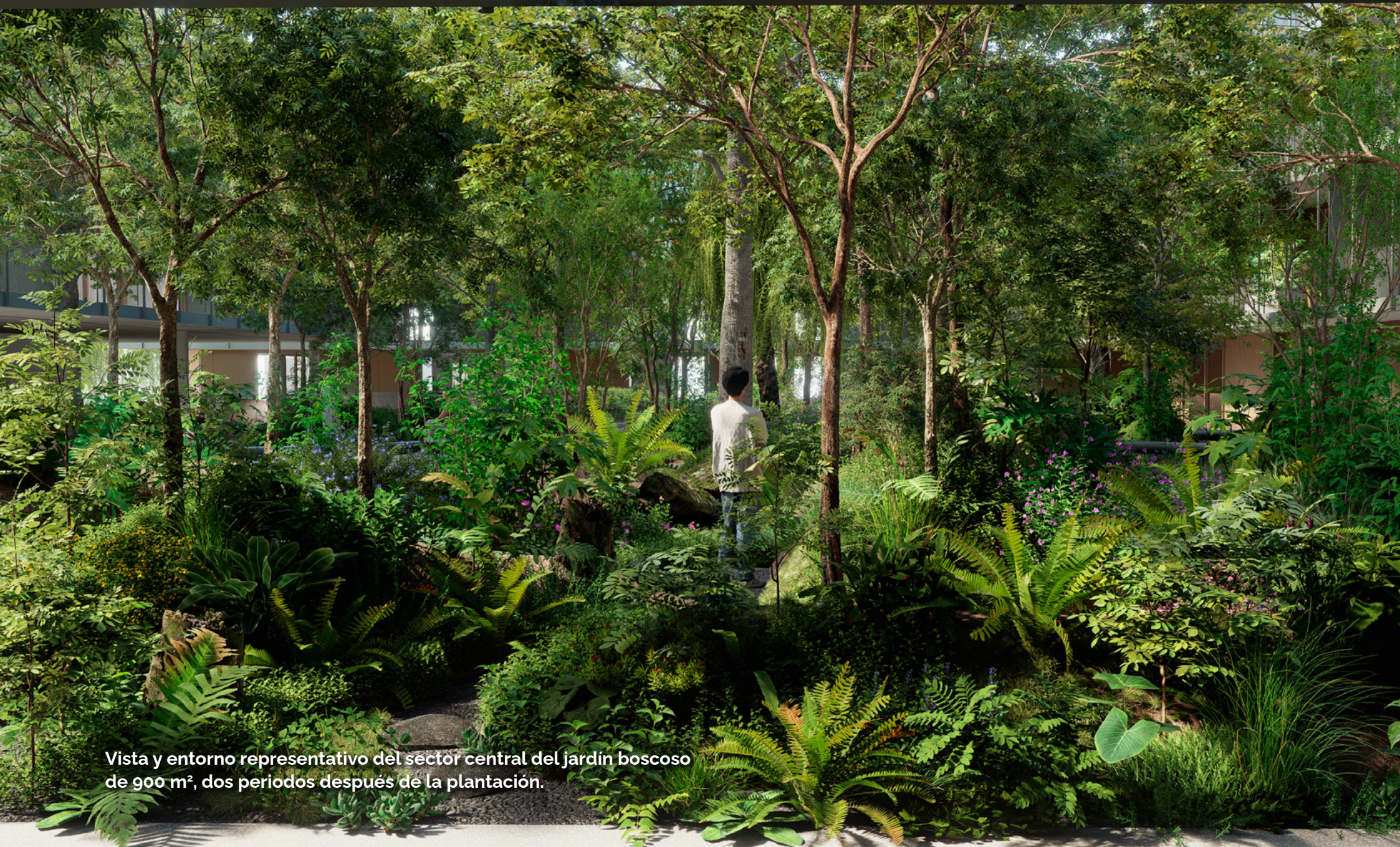
Vista y entorno representativo del sector central del jardín boscoso de 900 m 2 , dos periodos después de la plantación.